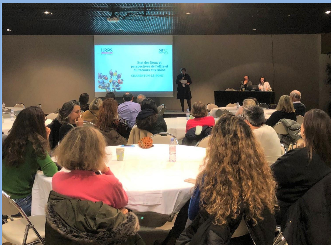
Rencontre des professionnels de santé de Charenton – 15 novembre 2023

CENTRE COMMUNAL D'ACTION SOCIALE Centre Alexandre Portier 21 bis, rue des Bordeaux 94220 CHARENTON-LE-PONT