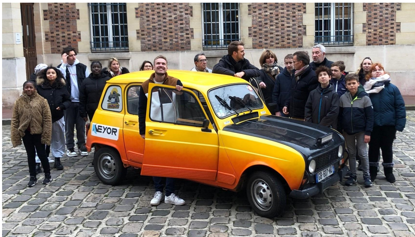
Départ du trophée 4L, le 4 janvier 2023, projet financé en 2022.