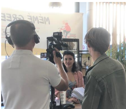
Fort retentissement médiatique pour le « Pass ô vert en juillet 2023

240 foyers bénéficiaires des bons Pass'O'vert – 70 200€ 50 inscriptions lors des 4 ateliers – 1 070€ Paniers AMAP pour l'association « Au petit plus » - 1 104€